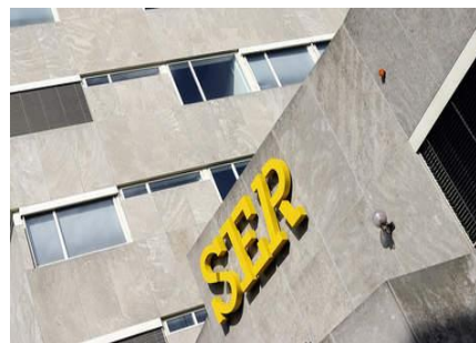
De VCP is centraal gevestigd in het gebouw van de SER in Den Haag.

Telefoon 070-3499740 Email info@vcp.nl Website www.vcp.nl Twitter @vcprofessionals